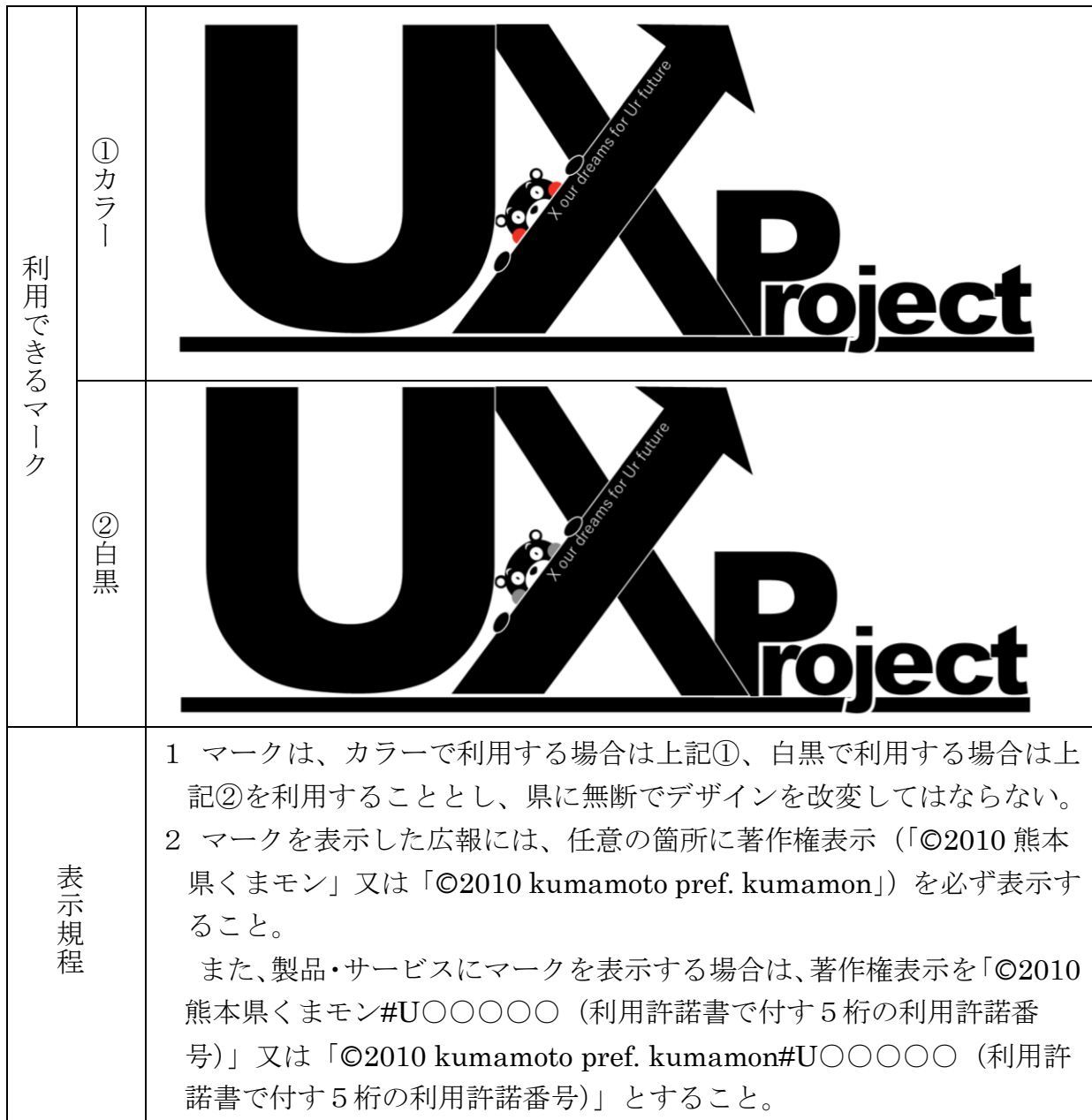
別表2：マーク表示対象となる広報及び製品・サービス（連携企業等による利用例）